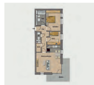
Beispielwohnung mit ca. 77 qm