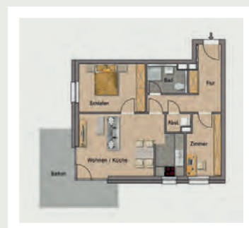
Beispielwohnung mit ca. 72 qm

RAUM FÜR FAMILIEN MIT EINEM ODER ZWEI BALKONEN.