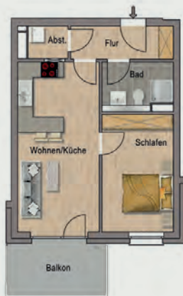
Beispielwohnung mit ca. 50 qm

Im Mittelpunkt der effizienten 2-Zimmer-Mietwohnungen steht ein großzügiger Ess- und Wohnbereich mit offener Küche. Hier kannst du gemütlich entspannen – allein oder mit Freunden. Auch für Stauraum ist gesorgt: Die Schlafzimmer bieten Platz für einen großen Kleiderschrank und im Abstellraum findet die Waschmaschine Anschluss.