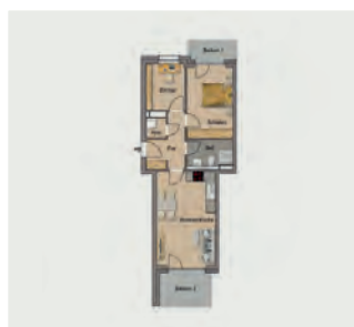
Beispielwohnung mit ca. 65 qm

FÜR JEDE LEBENSIDEE DEN PASSENDEN GRUNDRISS!