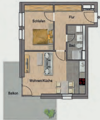
Beispielwohnung mit ca. 57 qm